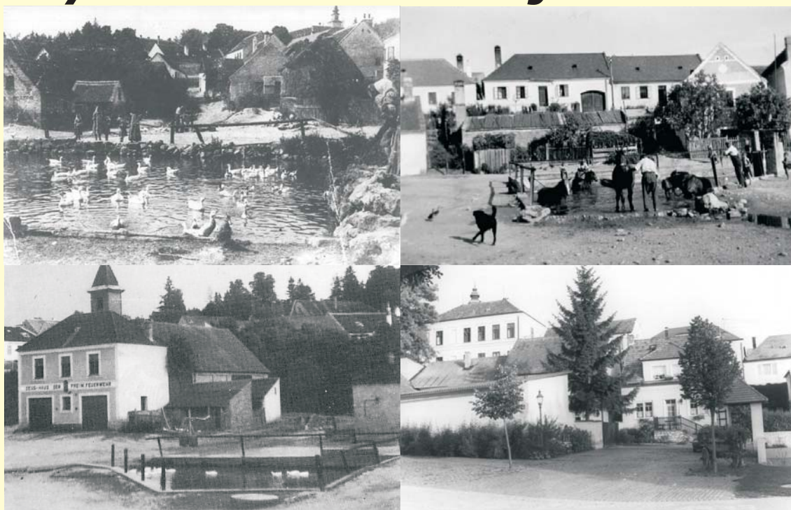
Schwemmplatz im Wandel der Zeit